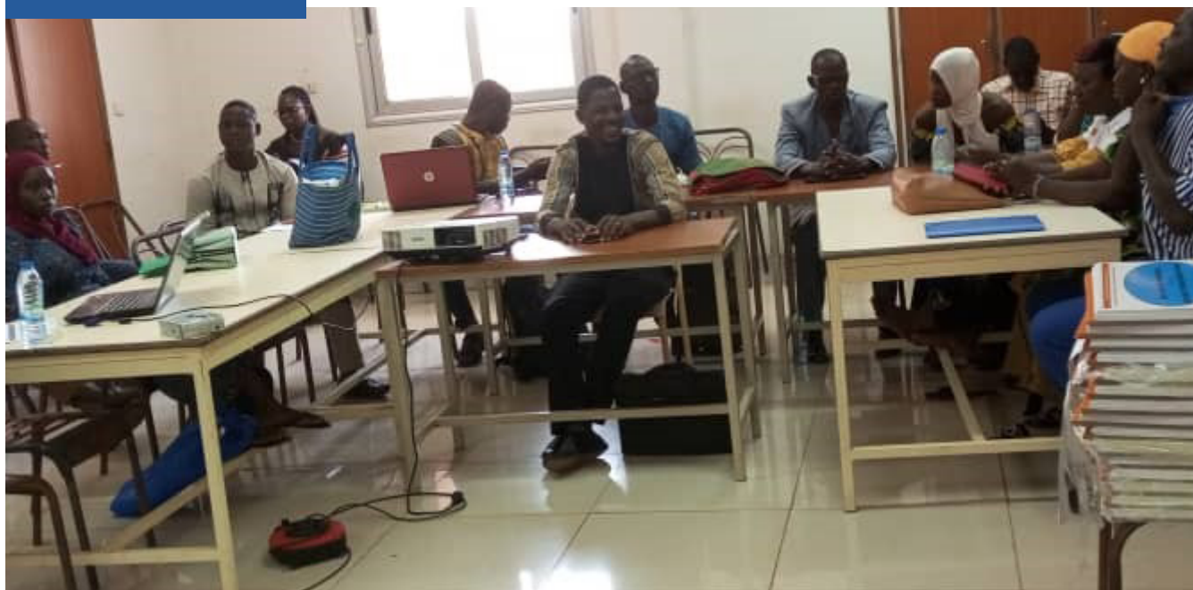
Aperçu des champions lors de la formation à Ouahigouya

leurs activités. En termes de réalisations ces leaders réalisé 80 sorties d'information des communautés pour la mise en place de nouveaux espaces de dialogue dans les 05 régions. Ils ont aussi réalisé 30 séances de Théâtres fora sur les VBG et le mariage d'enfant (ME) qui ont touché 27099 personnes dont 14560 femmes. Dans les espaces de dialogue parents-enfants, ils ont sensibilisé 12239 personnes dont 5826 hommes et 6413 femmes sur les VEFF et les VBG.