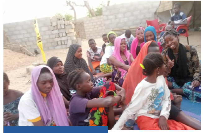
Animation de session de sensibilisation dans les espaces sûrs à Fada (à gauche) et à Dori (à droite)

Dix-huit (18) centres de formation professionnelle du Ministère en charge de la jeunesse ont pris en compte l'EVF dans leurs programmes de formation à travers la dispensation effective du module sur la SSRAJ au profit de leurs apprenants. Parmi ces 18 centres, on dénombre 08 centres publics et 10 centres privés. Mille six cent quatre-vingt-trois (1683) apprenants dont 769 filles et 912 garçons ont été touchés par le programme santé sexuelle et reproductive des adolescents et des jeunes.