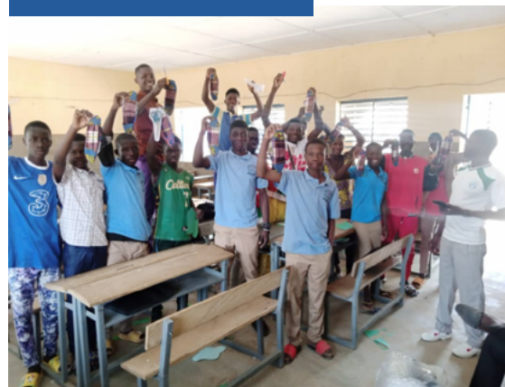
Séance de confection de serviettes hygiéniques par des jeunes élèves garçons au profit des filles

Une rencontre annuelle de bilan et de partage de connaissances entre les réseaux régionaux a été organisée en décembre 2023. Le nettoyage des toilettes des filles par les garçons, la confection et/ou l'achat des serviettes hygiéniques au profit des filles par les garçons dans certains établissements sont identifiés comme bonnes pratiques induites par les interventions des clubs de masculinité positive.