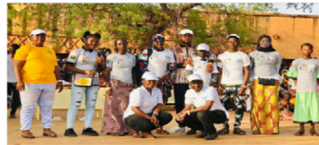
Remise de t-shirts et gadgets aux élèves lors du Time Show, Lycée Yamwaya de Ouahigouya, 20 Mai 2023