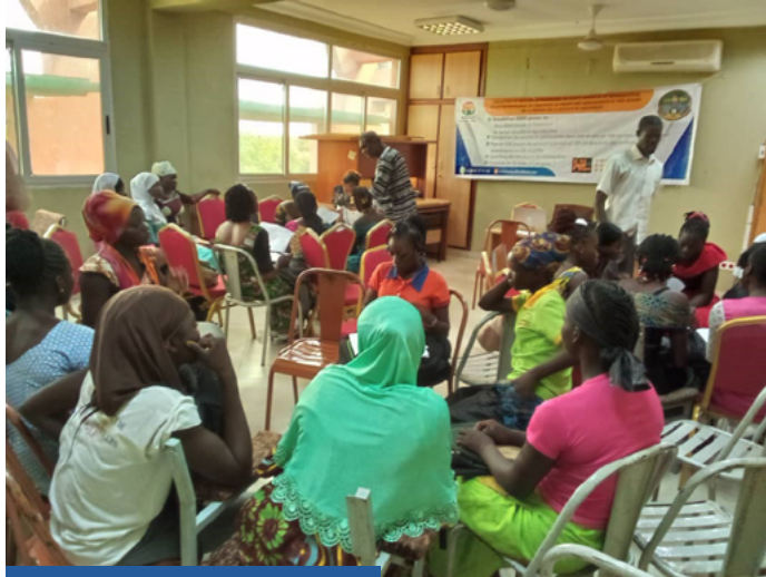
Photo d'une séance de formation en éducation financière à Dédougou

Trente-quatre (34) sessions de formation sur l'éducation financière et l'entrepreneuriat simplifiée dans les régions de la boucle du Mouhoun et du nord ont été réalisées par l'UNCDF en faveur des adolescents et jeunes. Ces sessions se sont déroulées dans huit (08) centres de formation aux métiers et neuf (09) structures de jeunes et adolescent. Les thèmes suivants sont abordés : la planification, la budgétisation, la gestion de la dette, la culture de l'épargne et la caution solidaire. Au total, 3842 adolescents et jeunes sont formés en éducation financière dont 2292 filles et 1550 garçons. Parmi les 3842 adolescents et jeunes 1232 sont des PDI.