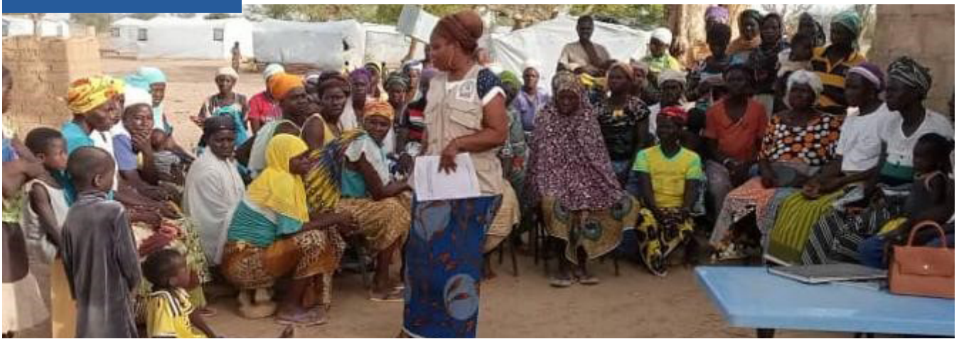
Séance de sensibilisation par les Agents DBC

Par ailleurs, Vingt (20) membres d'associations de jeunes ont été formés sur la DBC dans le district de Manni. Pour la conduite du dialogue parent-enfant sur la SRAJ, 2880 sorties ont été effectuées par les 120 facilitateurs communautaires des 12 districts couverts, soit 1440 sorties dans la région du Centre-Nord et 1440 sorties dans la région de la Boucle du Mouhoun. Ces sorties ont permis de sensibiliser 27 612 personnes dont 14 982 femmes dans 28 800 ménages. Le nombre d'adolescent-e-s et jeunes sensibilisés est de 11 881 personnes.