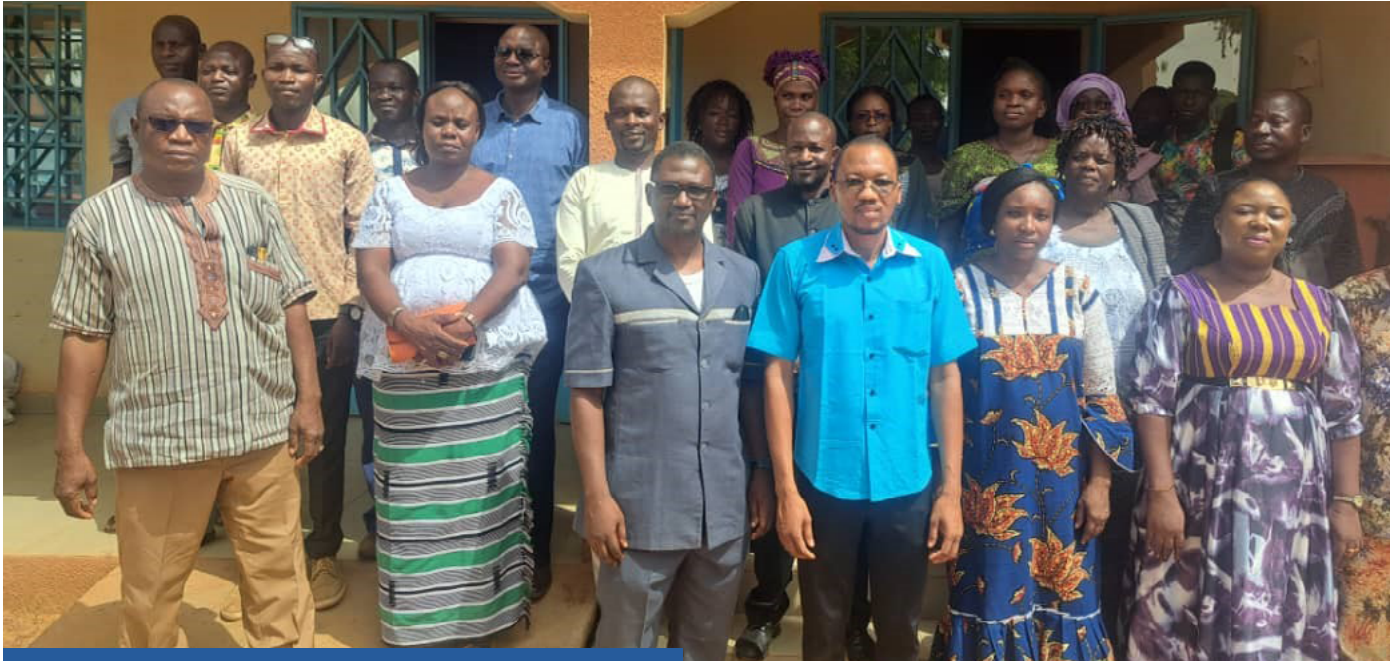
Photo de famille des participants à la session de formation sur la masculinité positive au profit des formateurs des centres à Kaya

Trente-deux (32) formateurs des centres de formation professionnelle dont 22 hommes et 10 femmes ont été formés à l'utilisation du module sur la santé sexuelle et reproductive des adolescents.