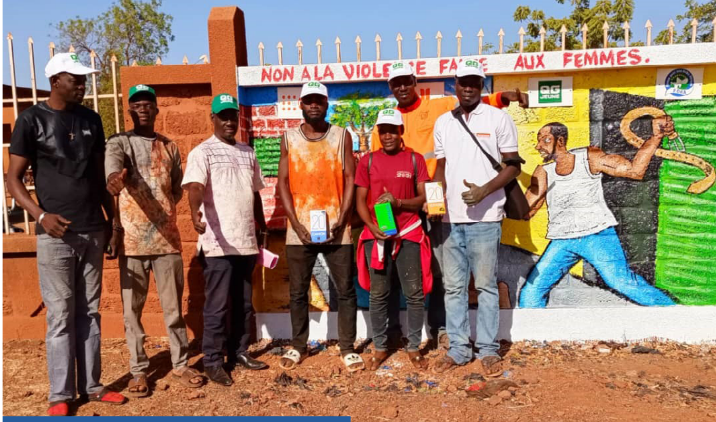
Street art (art de rue) à Ouahigouya

Une capsule vidéo de témoignage d'utilisateurs de QG JEUNE à l'occasion de la journée de lutte contre le SIDA est réalisée et diffusé. Le lien de la capsule vidéo :