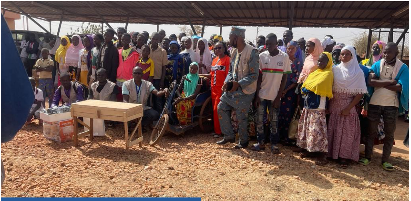
La directrice Pays de l'ONG Abba's International ici en rouge aux côtés de l'adolescente handicapée bénéficiaire avec tous les autres bénéficiaires, les TAC et les mentors de Ouahigouya

Dans le cadre de l'inclusion financière, l'UNCDF a organisé une activité de promotion au profit de 200 adolescents et jeunes à Dédougou. A cette occasion, deux Institutions de Microfinance (IMFs) à savoir la Caisse Populaire et GRAINE SARL ont fait une communication sur les produits financiers susceptibles d'intéresser les jeunes. Au cours de cette activité, 90 jeunes et adolescents ont été mis en relation avec les institutions de financement et 331 tire-lire exposés dont 61 vendus par des jeunes ouvriers de la menuiserie.