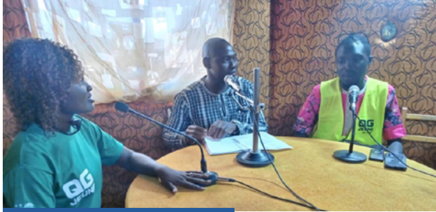
Emission radio à Kaya

https://drive.google.com/drive/folders/1fgWhZ-tAT5Wf3rELc9kxm2ThNFrvm0FF0?usp=sharing