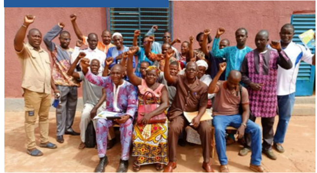
Formation des membres APE/COGES sur les normes sociales favorables et la SRAJ dans la BMH

Un «Time-show» (animation grand-public) a été organisé par MSIBF au Lycée Yamwaya de Ouahigouya. L'animation a consisté à la distribution de dépliants et de cartes du centre de contact, la distribution de gadgets, et une séance de questions réponses sur la SRAJ. Plus de 200 jeunes et adolescentes ont été sensibilisées sur les thèmes suivants : Grossesses Non-désirées, VIH et IST en milieu scolaire